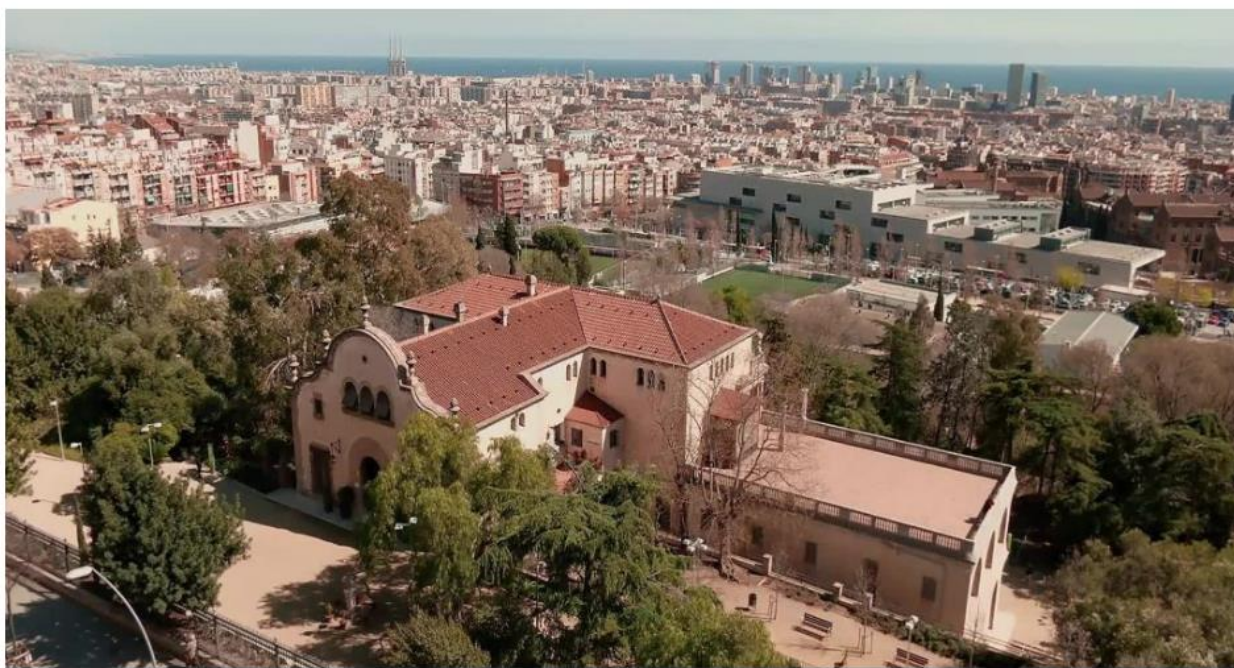
La reforma de l'espai ha estat una de les grans obres de l'ajuntament a Horta-Guinardó