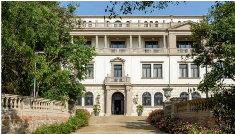
Casa Museo Nuria Pla