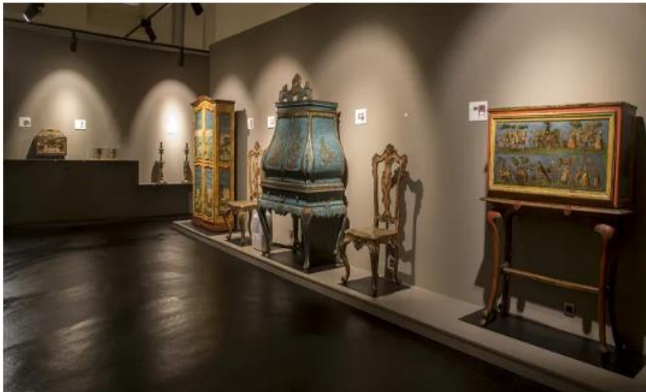
Casa Museo Nuria Pla

El piso superior de la casa, mantiene las estancias con toda la espectacularidad y lujo de detalles de esta familia ilustres de Barcelona.