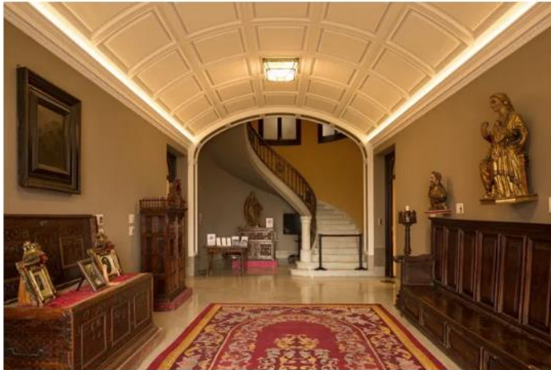
Casa Museo Nuria Pla