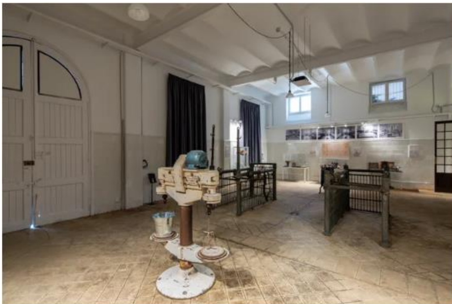
Casa Museo Nuria Pla

Además de las exposiciones principales, la Casa Museo Nuria Pla también acoge eventos culturales y conferencias relacionadas con su historia, ligada a la medicina y al coleccionismo de mueble. Si te apasionan los objetos y lugares con historia y la medicina y la investigación, no puedes perderte la visita a la Casa Museo Nuria Pla. ¡Sumérgete en este pedazo de pasado de la ciudad de Barcelona!